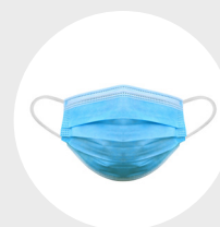
Masque de procédure

Le couvre-visage n'est PAS un équipement de protection suffisant. Il peut être porté par les joueurs en supplément des mesures décrites ci-dessus.